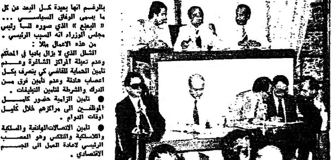
رئاسة المجلس والحكومة قبل بداية الجلسة

وتحدث عن قانون المخابرات قال: عزنت ودعت اقتنى من منشا الحزن هذا، ودونت جولا مقبضا عن أعمال كان بالآمان أنجزها ولم تنجز المأمورة. وقال: نريد العدالة للجميع ، ونريد منكم أن تبعوا أي سخر يتخلل في شؤوننا. والتمنى إلى القول: سيروا بقيادة الرئيس فتن جرائنا من أمابكم وورائكم.